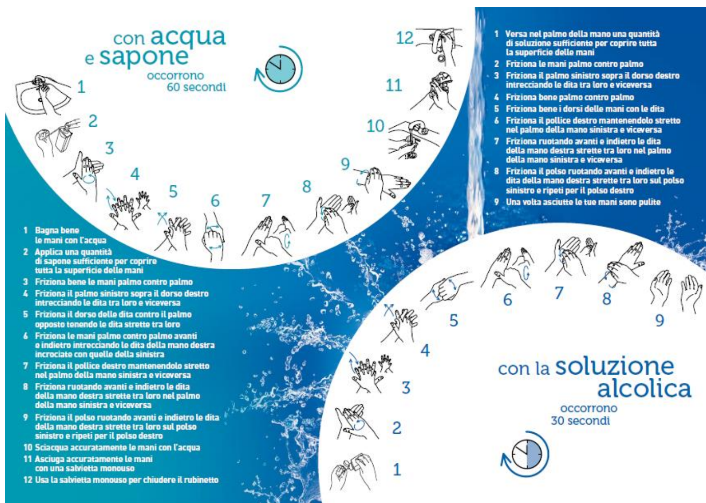
Riferimento 1 – ALLEGATO 4

Per le tecniche di dettaglio “ Lavaggio delle mani ” si rimanda alle infografiche “ Riferimento 1 e 2 dell'ALLEGATO 4 ”. Di seguito si riportano le rappresentazioni infografica in formato ridotto: